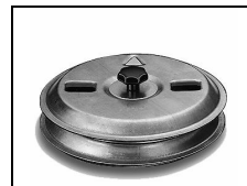
Klappensteller KS 25