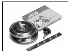
Klappensteller KS 10 mit Hebel