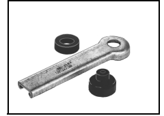
Flanschbügel bereits vormontiert